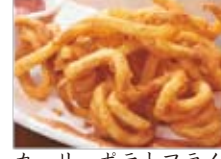
カーリーポテトフライ 600円(税込648円)