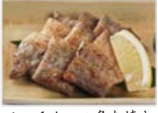
ソーチカーの炙り焼き 750円(税込810円)