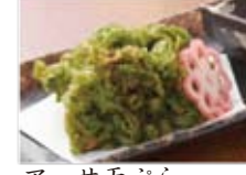
アーサ天ぶら 680円(税込734円)