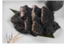
ミノガル 720円(税込777円)