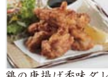
鶏の唐揚げ香味ダレ 750円(税込810円)