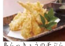
島らっきょうの天ぶら 780円(税込842円)