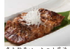
炙り軟骨ソーキの山葵添え 980円(税込1058円)