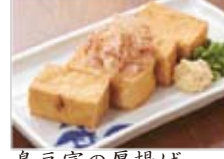
島豆腐の厚揚げ 450円(税込486円)