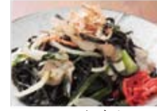
イカスミ塩焼きそば 780円(税込842円)