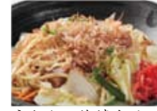
うちなー塩焼きそば 750円(税込810円)