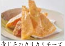
青じそのカリカリチーズ 600円(税込648円)