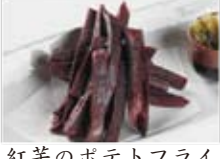
紅芋のポテトフライ 780円(税込842円)