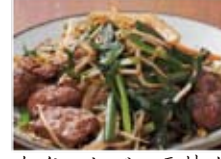
あぐーレバニラ炒め 880円(税込950円)