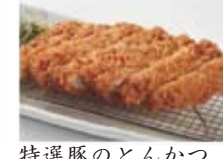
特選豚のとんかつ 1180円(税込1274円)