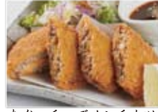
あぐーチーズメンチカツ 780円(税込842円)