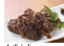
もずく天 680円(税込734円)