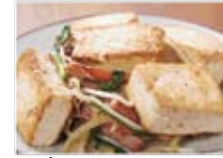
豆腐ちゃんぷるー 680円(税込734円)