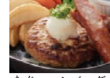
あぐーハンバーグ 1180円(税込1274円)