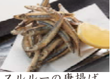
スルルーの唐揚げ 680円(税込734円)