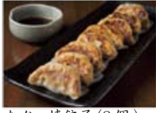
あぐー焼餃子(8個) 1080円(税込1166円)