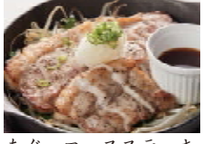
あぐーロースステーキ 1280円(税込1382円)