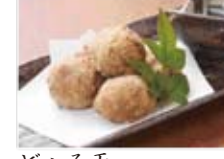
どうる天 680円(税込734円)