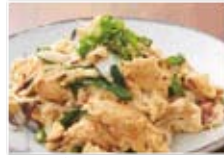
ふーちゃんぷるー 680円(税込734円)