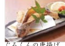
ぐるくんの唐揚げ 880円(税込950円)