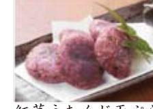
紅芋うむくじ天ぶら 680円(税込734円)