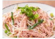
そーめんちゃんぷるー 680円(税込734円)