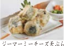
ジマーミーチーズ天ぶら 780円(税込842円)