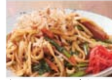
うちなーソース焼きそば 750円(税込810円)