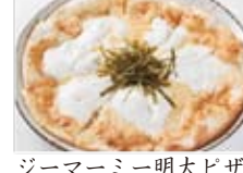
ジマーミー明太ピザ 980円(税込1058円)