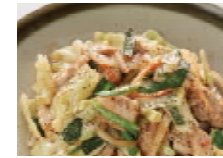
キャベツとソーチカー炒め 780円(税込842円)