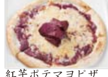
紅芋ポテマヨピザ 880円(税込950円)