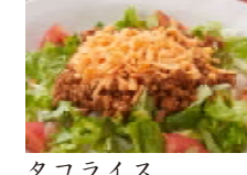
タコライス 880円(税込950円)