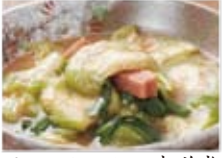
ナーベラー味噌煮 750円(税込810円)