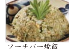
フーチバー焼飯 780円(税込842円)