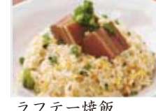
ラフテー焼飯 780円(税込842円)