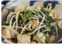
ちきなーちゃんぷるー 680円(税込734円)