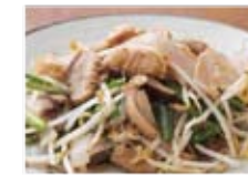
中身イリチー 750円(税込810円)