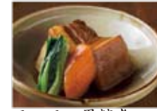
ラフテー黒糖煮 780円(税込842円)