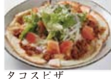
タコスピザ 880円(税込950円)