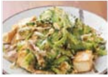
ゴーヤーちゃんぷるー 780円(税込842円)