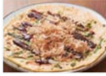
ヒラヤーチー 650円(税込702円)