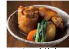
てびちの煮付け 880円(税込950円)