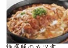
特選豚のカツ煮 1280円(税込1382円)