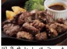
国産牛ヒレスステーキ 1980円(税込2138円)