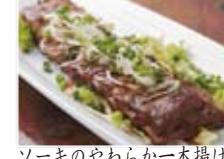
ソーキのやわらか一本揚げ 1380円(税込1490円)